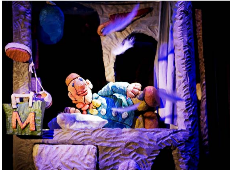
Soucis de plume

Débutent alors le voyage et la rencontre avec le cortège des maux du siècle : réchauffement climatique, effets de la radioactivité, grippe aviaire... « tout ne va pas si bien ! » se doit de constater M. Petitmonde. Placé sur les rails de son enquête – mais d'où vient la plume – il ne dévie pas d'un pouce de l'objectif qu'il s'est fixé. Au fil du récit, on assiste à des dialogues entre personnages, on découvre des situations désespérées qui aboutissent souvent au même constat : « ça ne va pas si bien que cela ». Toutefois, l'échange reste illusoire, les malheurs des autres ne parviennent pas à percer le cortex de M. Petitmonde. En fin de parcours, les escaliers divins qui le mènent chez les anges lui dévoileront un grand vide, qui est peut-être celui de sa propre personne. Qu'importe ! Il s'en retourne chez lui, range les malheurs dans le tiroir prévu à cet effet, le referme, puis s'affaisse sur son oreiller en se rassurant : « tout va bien ».