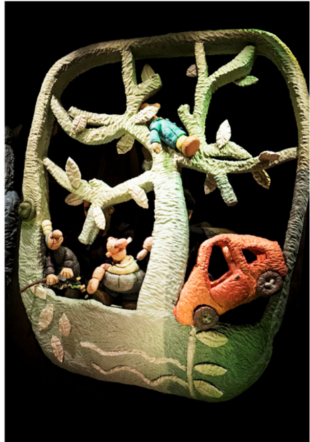
Soucis de plume

La quête de Monsieur Petitmonde va l'immerger dans un univers tendre et fantastique, qui rappelle les « Voyages en zigzag » du papa de la bande dessinée, Rodolphe Töpffer. Insérés dans un dispositif scénique en paravent mobile s'articulant délicatement, les comédiens marionnettistes recréent ce voyage au centre d'un bestiaire baroque. Dans un décor coloré en mousse latexée agité de médusantes métamorphoses avec un escalier se repliant et ne menant nulle part, Monsieur Petitmonde peut explorer des univers parallèles. Serpent farceur et diabolin philosophe à ses heures s'y pressent, tissant un imaginaire foisonnant. Le périple de Petitmonde croise des préoccupations