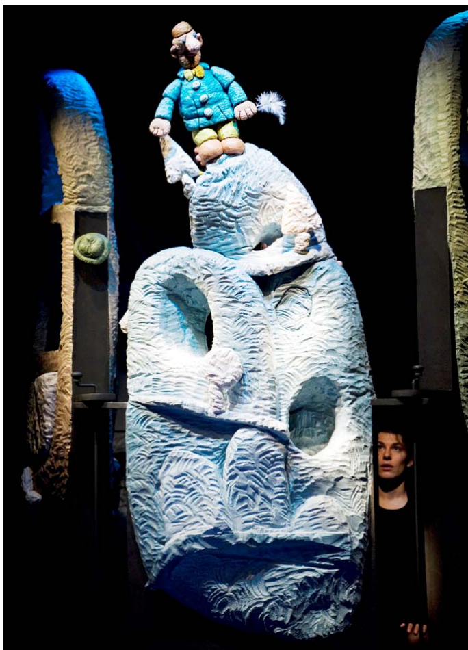
Soucis de plume

J'ai souvent été marqué par ces faits divers pointant des personnes anonymes partant parfois vers des aventures insensées, dont le point de départ, initialement insignifiant, bouleverse de manière souvent très forte leur vie. On peut citer ici, par exemple, les crises touchant le couple, par exemple.