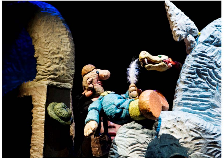
Soucis de plume

Le décor se présente sur le principe de panneaux mobiles reliés entre eux, à la manière d'un paravent que l'on peut déplacer pour créer l'espace. L'image scénique se module à vue avec les éléments mobiles, tandis que l'action occupe le centre du plateau – ou tourne autour. Un arbre – élément principal de l'un des panneaux - marque ainsi l'horizon lointain ou pourrait figurer un jardin. Placé sur le devant du dispositif, il prend toute son importance et devient le dernier survivant de la « forêt de l'arbre solitaire ». Un clin d'œil à la thématique environnementale qui sous-tend la pièce.