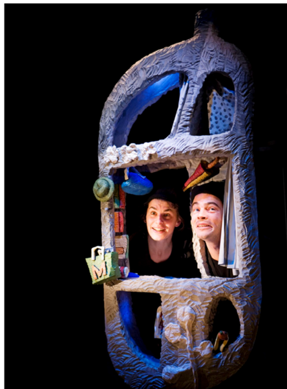
Soucis de plume

Tchernobyl, grippe aviaire, manipulation génétique, crise du logement, pénurie de pétrole, réchauffement climatique, horaires syndicaux (éléments notamment attrapés çà et là par Mme Petitmonde au fil de ses lectures de magazines).